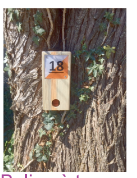
Balise à trouver